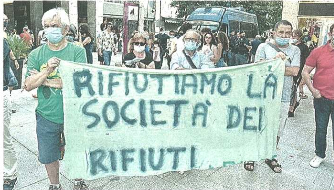
La manifestazione dei comitati che chiedono la chiusura dell'inceneritore sabato a Legnano