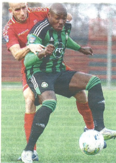
Giornata difficile per Ibe contro un Chieri che ha concesso poco alla Castellanzese: i neroverdi hanno comunque retto fino in fondo