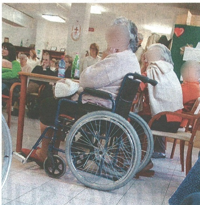
Una sala della Rsa Moroni di Castellanza

I problemi erano sorti il 5 settembre scorso, in seguito alle dimissioni dell'équipe della dirigente sanitaria. Si era quindi tenuto un incontro fra direttore generale, amministratori della Fondazione e un nutrito gruppo di familiari degli assistiti, giustamente allarmati dalle defezioni. La dirigenza aveva fornito rassicurazioni su quanto si stava facendo per ricostruire un valido gruppo di professionisti e ci si era dati appuntamento di lì a qualche mese per aggiornare la situazione. La promessa è stata mantenuta: pochi giorni fa si è tenuto un nuovo incontro, anche questo molto partecipato, in cui è stato presentato il nuovo staff, opera-