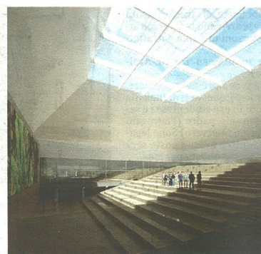
Ecco alcune immagini che danno l'idea dell'impatto che avrà il progetto Mill su Castellanza. Attorno all'ex cotonificio saranno realizzati spazi di grande vivibilità