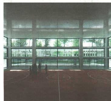
Stefano Di Maria © RIPRODUZIONE RISERVATA