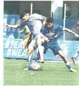
LA CORSA SALVEZZA