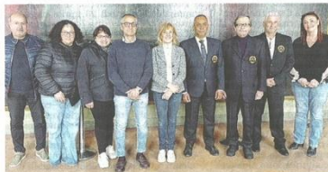
La presentazione dell'evento che si svolgerà al Palaborsani

CASTELLANZA (p.10) Si svolgeranno al Palaborsani domani, sabato, e domenica, i Campionati Nazionali di Karate. Le competizioni coinvolgeranno oltre 500 atleti provenienti da tutta Italia e riguarderanno gare individuali e a squadre in tutte le categorie, dagli under 6 fino ai seniors e veterans. I più piccoli si cimenteranno in un percorso di gara misto e con il palloncino. A partire dalla categoria childrens invece, le discipline in gara previste saranno il kata (esercizi in singolo senza avversario) - e il kumite, con il combattimento vero e proprio e la presenza dell'avversario. «Siamo entusiasti di poter accogliere questa competizione sportiva di rilevanza nazionale - hanno dichiarato il