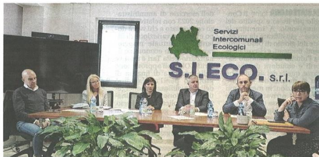
La conferenza dei sindaci dei Comuni soci di Sieco per chiedere chiarezza sul futuro di Cassano Magnago