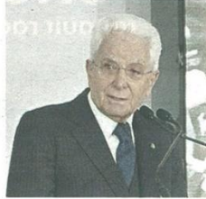
Castellanza, tramite il prefetto