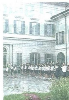
La fiaccolata giunta davanti al Municipio