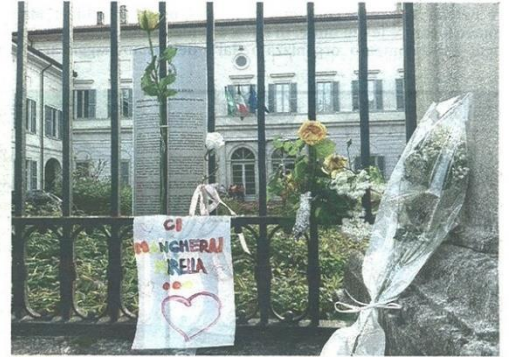
Flori e messaggi lasciati all'ingresso del municipio di Castellanza (Bltz)