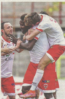
CITTÀ DI VARESE 2 CASTELLANZESE 2