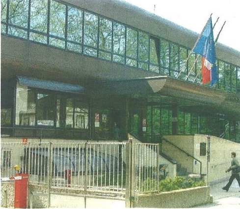
Iniziativa in occasione della giornata mondiale dell'infermiere