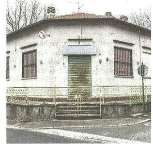
Al posto del Bar Acli un centro aggregativo o una comunità per disabili

pubblicato il 28/03/2019 a pag. 30; autore: Stefano Di Maria