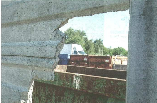
La piattaforma ecologica è da sempre in balia dei saccheggi