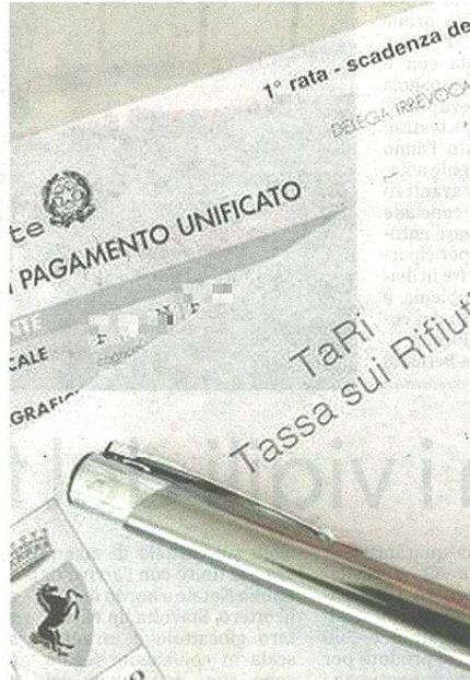
Importanti riduzioni della Tari concesse dal Comune di Castellanza a scuole ed enti del Terzo settore

Ecco l'elenco dei beneficiari degli sgravi decisi da Palazzo Brambilla: all'asilo infantile Pomini 460,30 euro su 1273,44; alla materna Cantoni 476 euro su 1317,12; alla Cooperativa sociale Acof Olga Fiorini 875,70 euro su 5mila 858,44; alla Cooperativa Il Progetto 812,60 euro su 2mila 248,40; alla Pro Loco 20,50 euro su 56; al centro diurno disabili Solidarietà Familiare 540 euro su 1.494,08; agli Amici del Teatro e dello Sport 64 euro su 176,64; alla Mensa del Padre Nostro - Caritas San Giulio 29 euro su