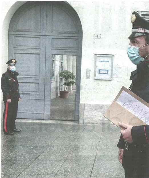
Nuovi sopralluoghi dei carabinieri nei municipi di Castellanza e Olgiate Olona

VALLE OLONA Carabinieri e Arpa: accertamenti su odori in stabilimento industriale