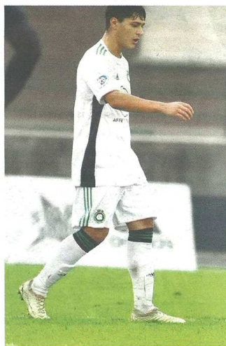
Non è bastata la buona prova di Perego per evitare alla Castellanzese una sfortunata sconfitta