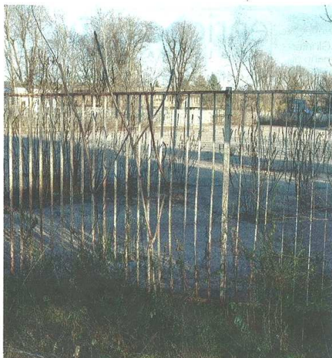
Qui sopra l'area della ex Mostra del Tessile destinata ad aree commerciali

Stefano Di Maria © RIPRODUZIONE RISERVATA