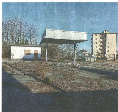
quello che resta del vecchio distributore del gas lungo via Italia. Il dibattito sulle aree dismesse si intensifica (B114)

pubblicato il 09/02/2022 a pag. 29; autore: Stefano Di Maria