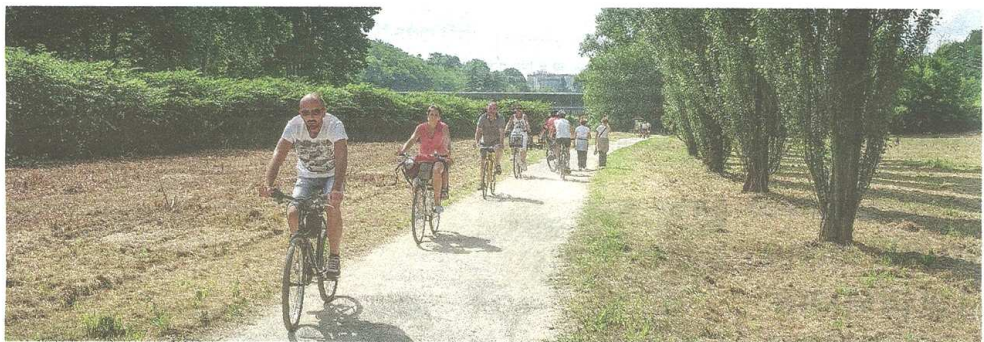
Le associazioni della zona rilanciano iniziative turistiche e culturali per valorizzare il territorio attraversato dal fiume Olona (8/12)

TURISMO SOTTO CASA Ripartono gli eventi su due ruote lungo la pista ciclopedonale che porta da Fagnano fino a Parabiago