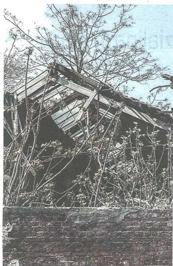
Crolla una lastra di cemento da un fabbricato all'ex fabbrica Pomini: detriti di vari materiali sono finiti a terra. Ancora incognite sul futuro dell'area

Esasperati i residenti ma il futuro dell'area è ancora incerto