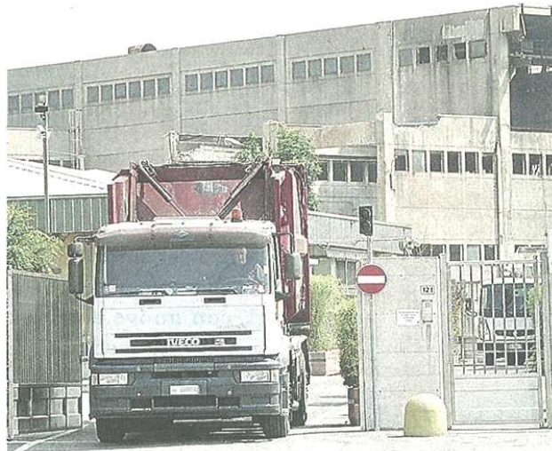
Il futuro dell'inceneritore Accam è una spina nel fianco di ogni amministrazione