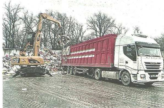
Raccolta dei rifiuti all'interno dell'inceneritore di via Arconate