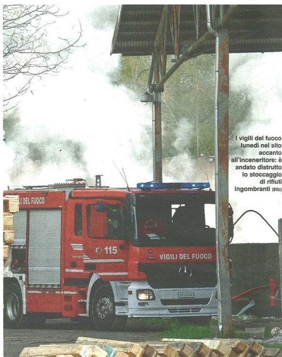
I vigili del fuoco lunedì nel sito accanto all'inceneritore: è andato distrutto lo stoccaggio di rifiuti ingombranti (Bilzi)

pubblicato il 13/04/2022 a pag. 28; autore: Angela Grassi