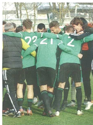
Esulta la Castellanzese: la vittoria contro la Casatese ha un sapore particolare