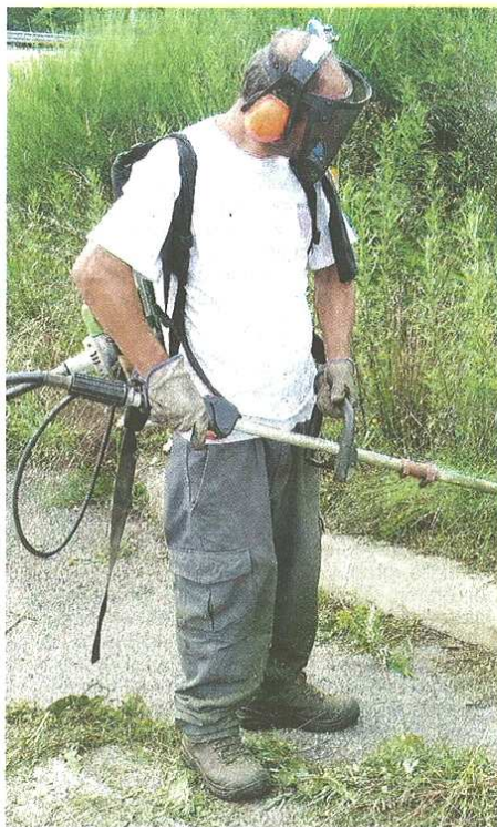
Tra gli interventi c'è anche la cura del verde (Biliz)

pubblicato il 06/08/2019 a pag. 30; autore: Stefano Di Maria