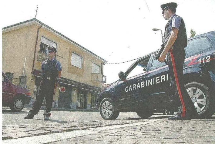
I carabinieri di Castellanza stanno cercando di risalire al responsabile dell'accoltellamento

Portato in ospedale è stato dimesso dopo sole poche ore