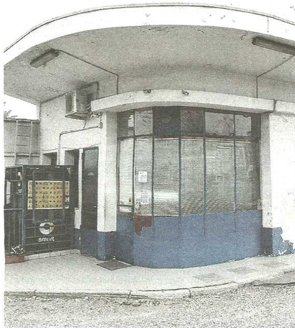
Lo storico distributore Moro lungo la Saronnese

Stefano di Maria © RIPRODUZIONE RISERVATA