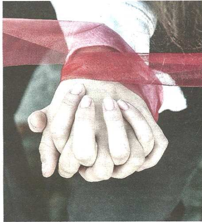
Il nastro rosso simbolo della lotta contro la violenza

pubblicato il 15/11/2020 a pag. 34; autore: Veronica Deriu