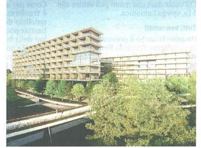
Uno dei rendering del progetto Mill di Univa (redazione)

Stefano Di Maria © RIPRODUZIONE RISERVATA