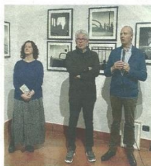
Inaugurato ieri pomeriggio, a Palazzo Marliani Cicogna, il dodicesimo Festival Fotografico Europeo, sempre più un'eccellenza. Oltre un mese di mostre ed eventi