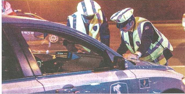
I controlli della polizia stradale si intensificano durante l'estate

pubblicato il 08/08/2019 a pag. 30; autore: Angela Grassi