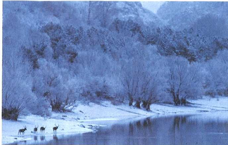
Uno scatto del fotografo naturalista varesotto Marco Colombo che si può ammirare a Olgiate Olona. Nella pagina accanto, una delle foto in mostra a Laveno Mombello

N uovo giro di inaugurazioni per il Festival fotografico europeo, organizzato dall'Archivio fotografico italiano in dieci città tra Varese e Milano. Ecce una scelta, rimandando a www.europhotofestival.it per il calendario completo. Oggi, venerdì 24, alle 18.30 allo studio legale Albè & Associati di Busto Arsizio, apertura della mostra «Volte delle donne» del fotoreporter Ugo Panella. Lo stesso giorno ma a Olgiate Olona, alle 21 al Teatrino di Villa Gonzaga, inaugurazione della mostra «I tesori del fiume» di Marco Colombo (wildlife photography) con proiezione commentata e presentazione dell'omonimo libro di Colombo, un'ode alla biodiversità delle acque dolci. Sabato 25 ci si sposta a Varese: alle ore 17 in sala Veratti, in via Veratti 20, per l'apertura della mostra «La luce svela l'intimità dei luoghi» di Claudio Argentiero, curatore del Festival. A Varese ricordiamo che è in corso un'altra mostra, allo Spazio Lavit di via Uberti 42: «Community» di Stefano Lanzardo e Simone Conti. Domenica 26 si torna a Busto, alle ore 11 alla Fondazione Bandera per l'Arte, in via Costa 29, per l'inaugurazione di: «L'altra faccia della luce» degli studenti dell'Istituto italiano di fotografia di Milano e «Allo specchio», degli studenti del Liceo artistico cittadino. Sempre domenica, ma a Villa Pomini di Castellanza: alle ore 14 c'è la lettura portfolio Premio Afi