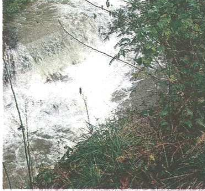
Una tratta del fiume Olona, al centro della seduta della commissione Ambiente di Regione Lombardia di ieri