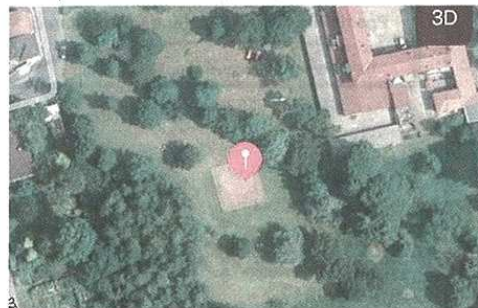
La ragazza si è ferita a una gamba nell'area verde

pubblicato il 10/09/2017 a pag. 29; autore: Stefano Di Maria