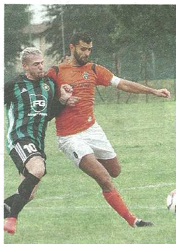
Non è stato fortunato il debutto della Castellanzese, rimontata e sconfitta sul campo dell'Ardor Lazzate

LAZZATE - Clamoroso hakirri della Castellanzese, che sotto una pioggia battente passa in vantaggio sul terreno dell'Ardor per poi subire una incredibile rimonta, addirittura in undici contro nove: onore all'animo pugnamdi dei padroni di casa, ma il secondo tempo dei neroverdi è stato davvero inguardabile. Atteggiamento speculare per le due squadre, un 4-4-2 che almeno per i primi dieci minuti i padroni di casa interpretano meglio. Primo brivido dopo soli sei giri di lancette, punizione per i padroni di casa da sinistra e palla che termina in rete: ma l'arbitro non aveva ancora fischiato. Il pericolo corso sveglia la Castellanzese, che pian piano prende il controllo della situazione. E al 17' si conquista il rigore del vantaggio. Azione di Greco sulla destra, palla per Milazzo che viene ingenuamente