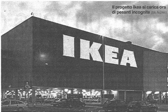
Il progetto Ikea si carica ora di pesanti incognite