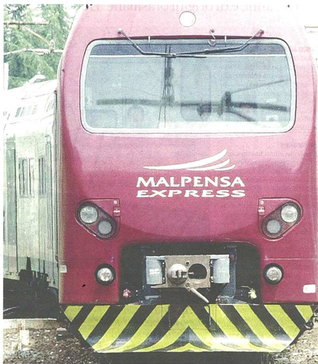
Il Malpensa Express è stato al centro di un'aspra polemica per il cambio di orari e fermate.