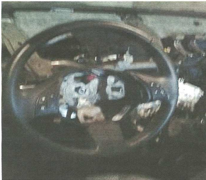
Ecco come è stata ritrovata l'auto dopo il raid dei ladri a Castellanza

CASTELLANZA - Auto "cannibalizzata" in via San Carlo nei pressi della Corte del Ciliegio. A dare l'allarme sono i proprietari che denunciano: «È come vivere nel Bronx». È successo nei giorni scorsi, quando la Fiat 500 di una ragazza parcheggiata dalle 21 alle 23 è stata portata via dai ladri che ne hanno smontato gli interni per poi riportarla sotto casa, riposizionandola vicino a dove era stata lasciata. Tremenda la scoperta: i ladri avevano smontato tutti gli interni, rubando quanto possibile, persino alcuni pezzi del volante. A denunciare l'accaduto una lettrice della Prealpina. «Non è accettabile che accadano queste cose: siamo senza parole - spiega la residente -. Il danno subito ammonta a settemila euro, non ci è rimasto che acquistare un'auto nuova». Oltre al danno, lo choc nel ritrovarsi l'auto letteralmente devastata. Continua la donna: «Dopo aver sporto denuncia, abbiamo scoperto che non siamo stati gli unici a subire l'assalto dei ladri sotto casa: pare che lungo l'asse del