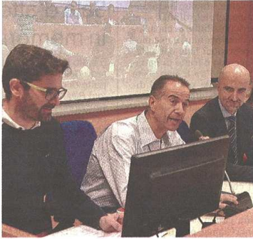
Ieri al Pirellino l'incontro sui disservizi postali

«Abbiamo portato al tavolo tutte le segnalazioni