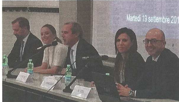
Un momento dell'incontro di ieri all'università Liuc di Castellanza

pubblicato il 20/09/2017 a pag. 9; autore: Carlo Colombo