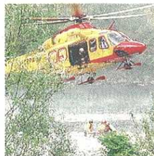
Per soccorrere il ciclista è decollato anche l'elicottero

Malore fatale per un ciclista di 52 anni residente a Castellanza: muore durante una sgambata con un amico. Il fatto è avvenuto intorno alle 15.30 in via Gaggio, a Lonate Pozzolo, stava appunto facendo una gita in bicicletta con un amico nella zona boschiva che circonda via Gaggio. Stando a quanto accertato dai carabinieri della compagnia di Busto, subito intervenuti insieme ai mezzi del 118 sul posto con ambulanza, automedica ed elisoccorso, il cinquantaduenne residente a Castellanza si è accasciato all'improvviso. L'amico ha subito capito che la situazione era grave e ha chiamato i soccorsi. I medici e il personale infermieristico sono arrivati in un lampo: per più di 40 minuti hanno continuato a rianimare il cicli-