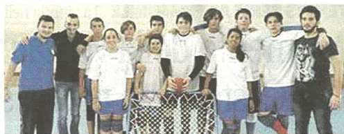
CARONNO KILLER WHALES