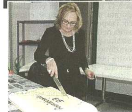
I festeggiamenti organizzati per il 33° anniversario dell'associazione

pubblicato il 20/11/2015 a pag. 60; autore: pil