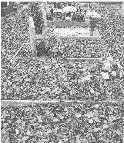
In alto uno dei cordoli dei viali interni, spaccato. Qui sotto, foglie ricoprono in toto una fila di tombe (foto Blitz)

CASTELLANZA - Serve maggiore attenzione per l'area cimiteriale, non solo quella interna ma anche esterna: non si può che arrivare a questa conclusione facendo un sopralluogo con gli abituali frequentatori del camposanto, che indicano tutto ciò che non va e a cui bisognerebbe porre rimedio.