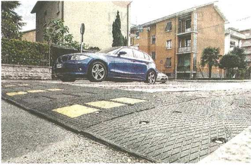
Il dosso di via Nizzolina, fonte di lamentele, da ieri non c'è più

Svolta in via Nizzolina. La giunta: «Promessa mantenuta»