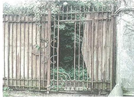
Due immagini dell'ex Cantoni: sopra, la cancellata divelta. A lato, un materasso buttato in mezzo ai rifiuti e probabilmente usato come giaciglio