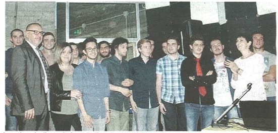
La cerimonia di premiazione degli studenti dell'Isis Facchinetti