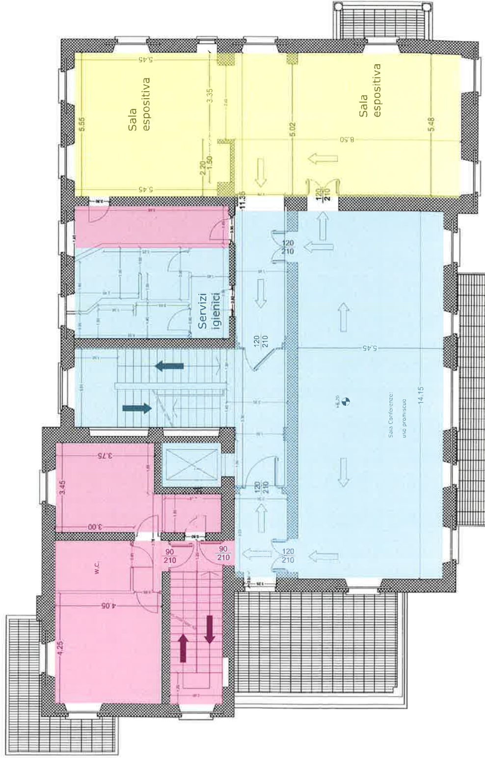
Planimetria Piano Primo