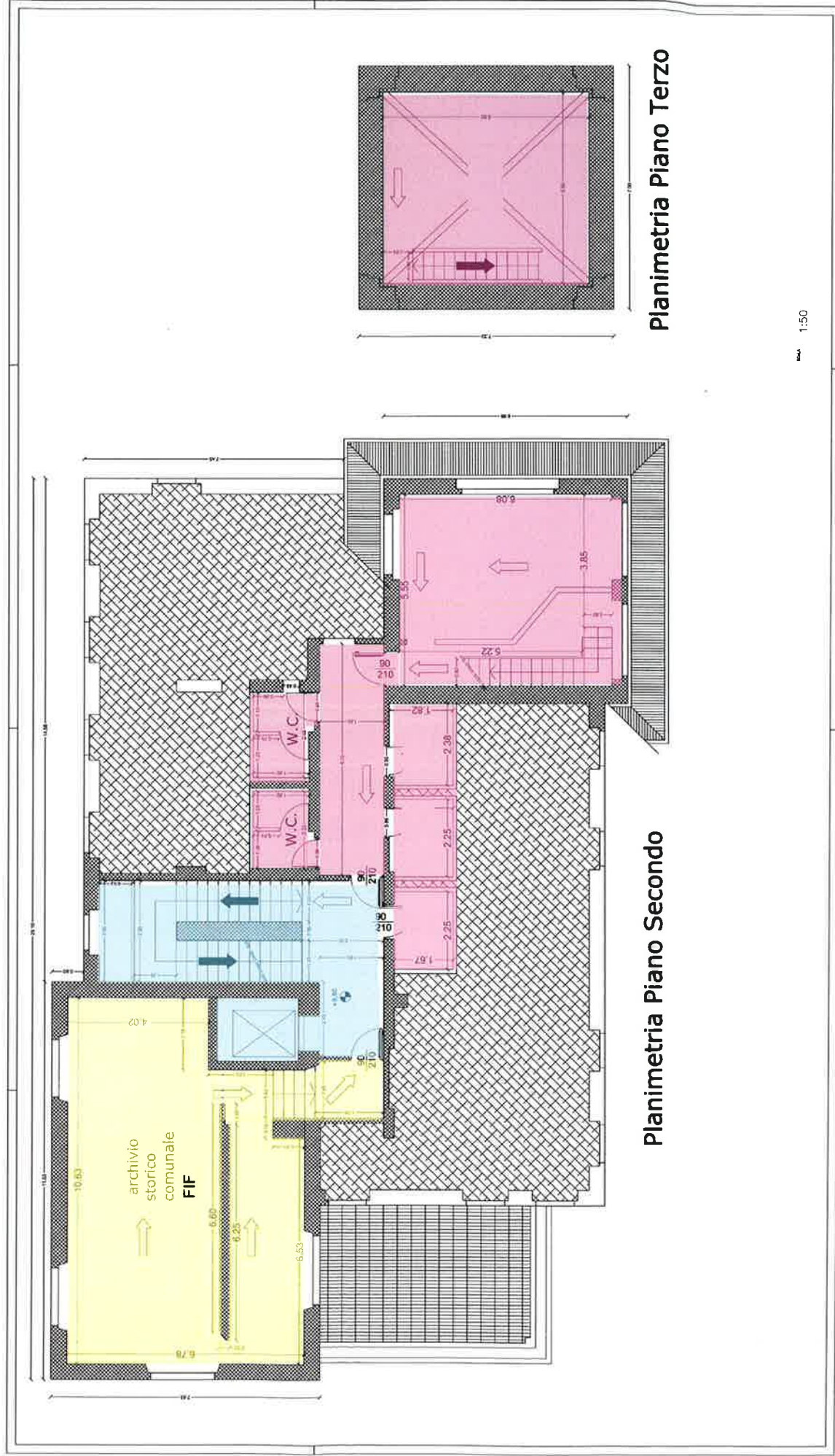
Planimetria Piano Secondo