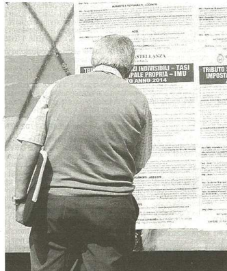
Pagare le tasse impone di informarsi a lungo

Non è previsto il pagamento della Tasi per chi possiede la seconda casa o un terreno in quanto tali beni sono già tassati dall'