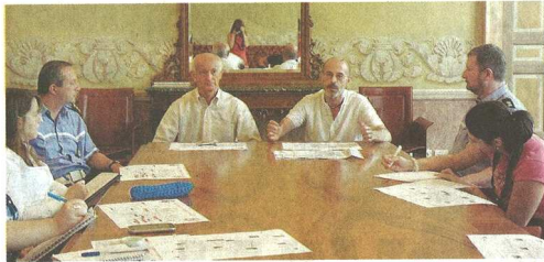
La conferenza stampa di presentazione del progetto messo a punto a Castellanza; a lato, i percorsi

A Castellanza le piste ciclabili di Castegnate sono in fase di completamento, ma questo è solo il primo step; con l'approvazione del bilancio inizieranno i lavori anche nella parte alta e tutto sarà pronto per la prima campanella