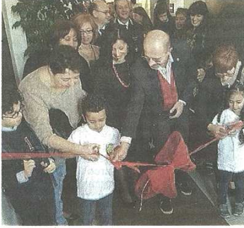
Aperta la mostra di uova, oggi e domani a Villa Pomini

Aperta la mostra "Eggs & Art" a Villa Pomini. C'è anche la Prealpina