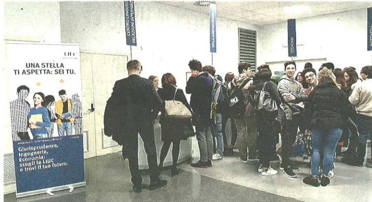
Gli studenti del futuro alla "giornata aperta" organizzata dalla Liuc

Il progetto Digital Do It Yourself (DiDIY): «È un nuovo fenomeno socio-tecnologico, incentrato sui dispositivi digitali che supportano, spesso attraverso comunità online aperte, la convergenza di atomi e bit». Secondo l'Università: «Le tecnologie e le dinamiche sociali correlate a DiDIY permettono la prototipazione e la fabbricazione di manufatti a partire da specifiche digitali. Ciò può portare a nuovi scenari nei ruoli e nelle relazioni fra individui, organizzazioni e so-