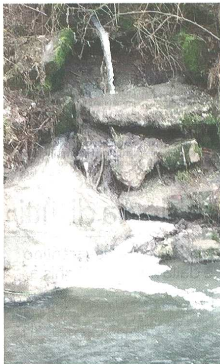
Una delle foto scattate ieri da Legambiente

pubblicato il 13/02/2017 a pag. 20; autore: Veronica Deriu