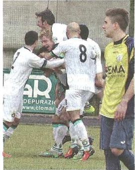
Nonostante una prestazione di grande orgoglio il Brebbia non è riuscito ad opporsi al rullo compressore Castellanzese