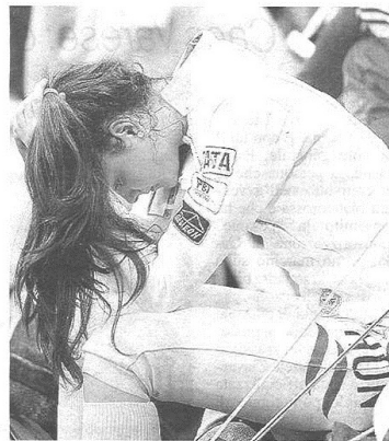
Due momenti della prima giornata del Trofeo Carroccio che ha visto disputarsi ieri gli assalti di qualificazione