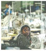
All'estero nuove competenze