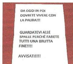
La "rivendicazione" contro il Pd

pubblicato il 13/11/2014 a pag. 1; autore: non indicato