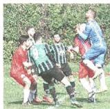
ARBITRO Lluza di Milano 6 Gara facile da arbitrare, coraggioso sul rigore del Tradate

CASTELLANZESE PASIANI SV Figore a parte, non deve compiere neppure una parata. PIGNATIELLO 6 Ordinato come sempre, ma spinge poco. ARRIGONI 7 Quando parte sulla fascia nessuno riesce a fermarlo. LIBRALON 6.5 Tanto ordine e disciplina in mezzo al campo. MARTINI 6 Non ha particolari problemi in mezzo alla difesa anche se causa il rigore del momentaneo pareggio. TAMAI 6.5 Il suo ritorno si fa sentire, la difesa non balla mai. PEDERNANA 7 Corre, attacca, difende e fa l'assist man. Ottimo come al solito (30' s.t. Tatan 6 Si imppegna). MORETTA 6.5 Il regista illumina spesso il gioco, soprattutto nella ripresa. COLOMBO 7.5 Tre gol, e una partita in cui è sempre pericoloso, compreso l'assist per Milazzo (30' s.t. Carraro 6 Qualche spunto). MILAZZO 6.5 Non comincia benissimo, poi si fa perdonare con alcune belle giocate, gol compreso (41' s.t. Porchera sv). CINOTTI 7.5 Migliore in campo, un vero e proprio incubo per la difesa avversaria.