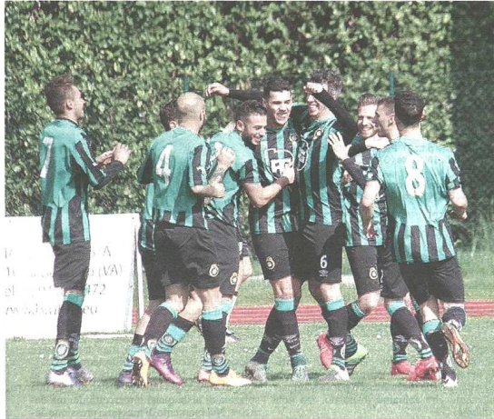
Colombo con il suo tris è stato il grande protagonista del trionfo della Castellanzese