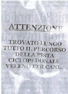
L'avviso affisso lungo la pista

SOLBIATE OLONA (gmt) Un avviso inquietante, affisso in vari punti della pista ciclo pedonale della valle da mano ignota: «Trovato lungo tutto il percorso veleno per cani». Che sia una reale messa in guardia diffusa da una persona con a cuore gli animali oppure un subdolo espediente ideato da qualcuno che mira a tenere lontani i cani dalla valle non è dato saperlo. Ma l'avviso ha fatto il giro del web in poche ore, raccogliendo tantissimi commenti di unanime condanna. Sulle pagine Facebook, nei messaggi sugli smartphone,