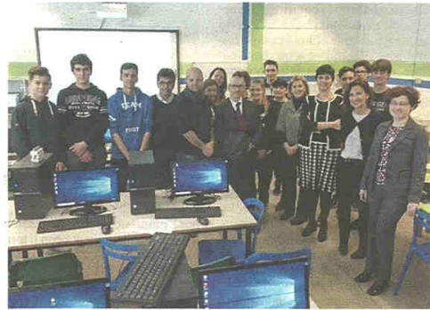
I ragazzi del Facchinetti sui banchi delle medie Da Vinci