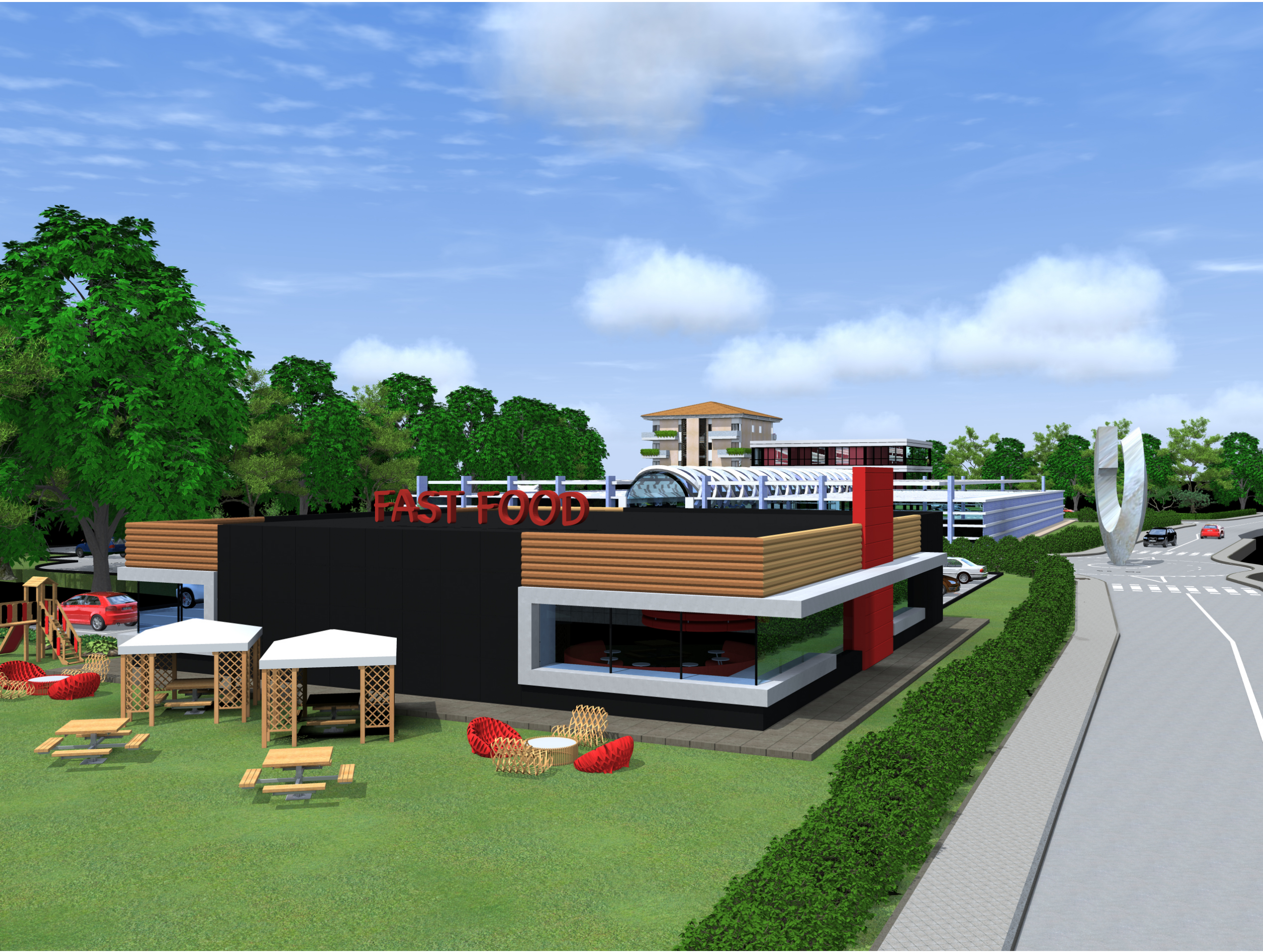
vista da Via Bettinelli