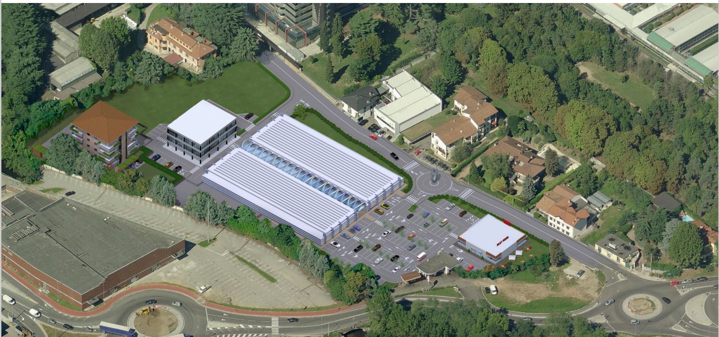
Tavola n. 8