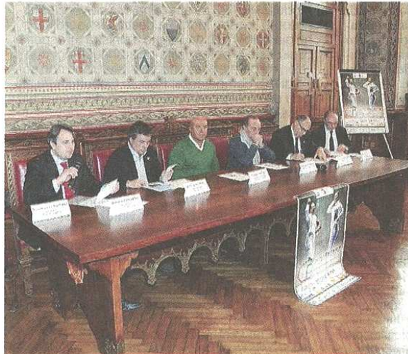
Un momento della presentazione del Trofeo Carroccio

pubblicato il 07/02/2017 a pag. 43; autore: Antonio Palella