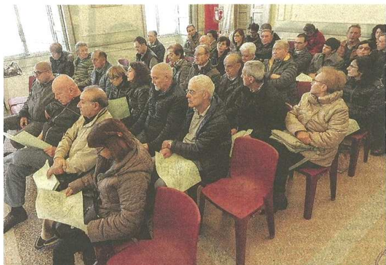
La riunione convocata ieri mattina ha registrato una buona partecipazione dei cittadini interessati dai provvedimenti: assenti questa volta i consiglieri di minoranza

L'incontro con i cittadini spinge a modificare il piano esteso alle vie Gramsci e Grandi