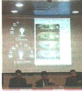
La presentazione dello studio

Efficienza energetica, nel campo dell'illuminazione ci sono «potenzialità concrete» da cogliere come opportunità per le nostre imprese. È quanto emerge dallo studio «Il valore aggiunto nell'adozione di sistemi di illuminazione avanzati. Un'indagine nel tessuto industriale della provincia di Varese», curato dal professor Emanuele Pizzurno della Liuc Business School e presentato ieri in università in occasione del secondo «EfficiencyDay» dell'Unione degli Industriali della provincia di Varese. Una «fotografia» di come le imprese della provincia di Varese approcciano il tema dell'innovazione tecnologica nel campo dell'illuminazione, che Pizzurno ha curato insieme