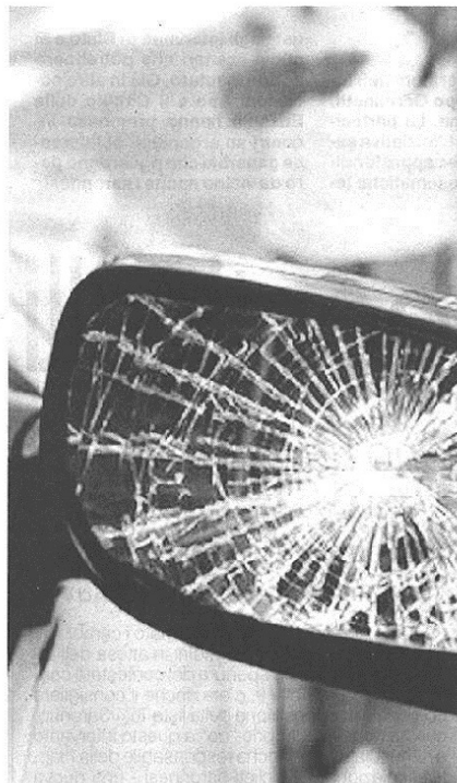
Torna di moda la truffa dello specchietto

La polizia locale: «Attenti a chi finge di conoscervi. Chiamate il 112»