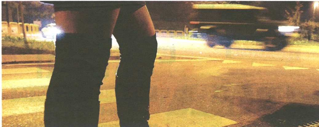
L'òa vicenda si è consumata per le strade di Busto Arsizio

BUSTO ARSIZIO La "lucciola" ha raccontato tutto ai carabinieri, allertati dai passanti