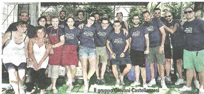
Il gruppo Giovani Castellanzesi