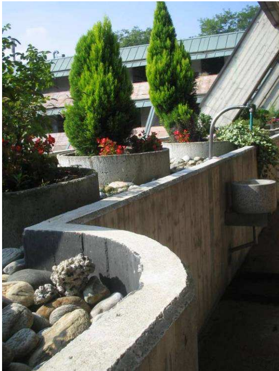
Fig.13 – Vista su fioriera da chiudere con lastra di pietra.