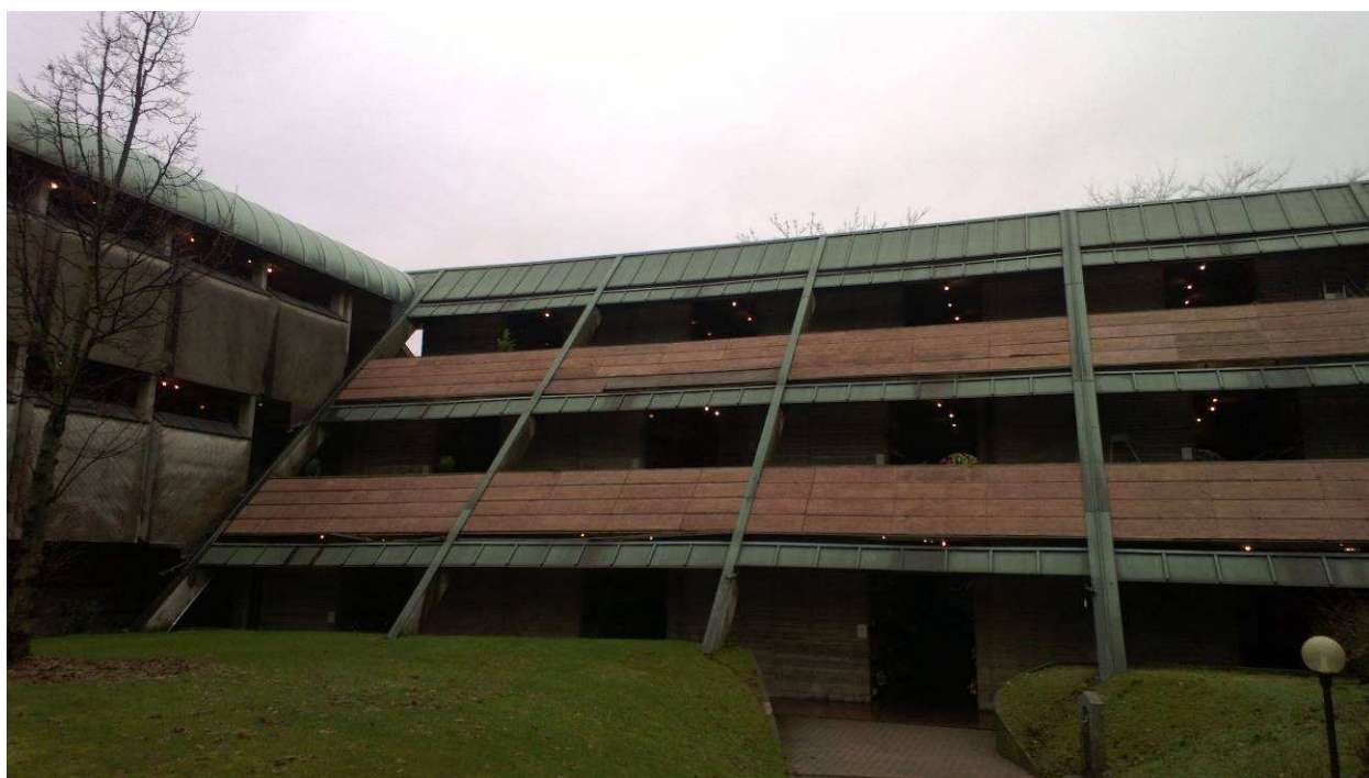
Fig.10 – Prospetto colombari con lastre di rivestimento delle fioriere mancanti.