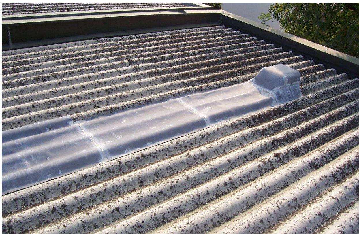
Fig.7 – Particolare aeratore esistente.