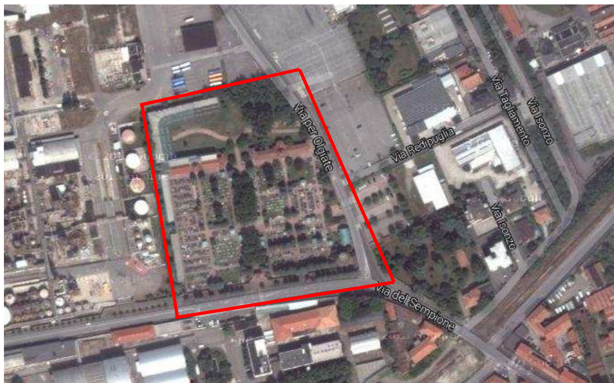
Fig. 1 – Immagine aerea Cimitero di Castellanza.