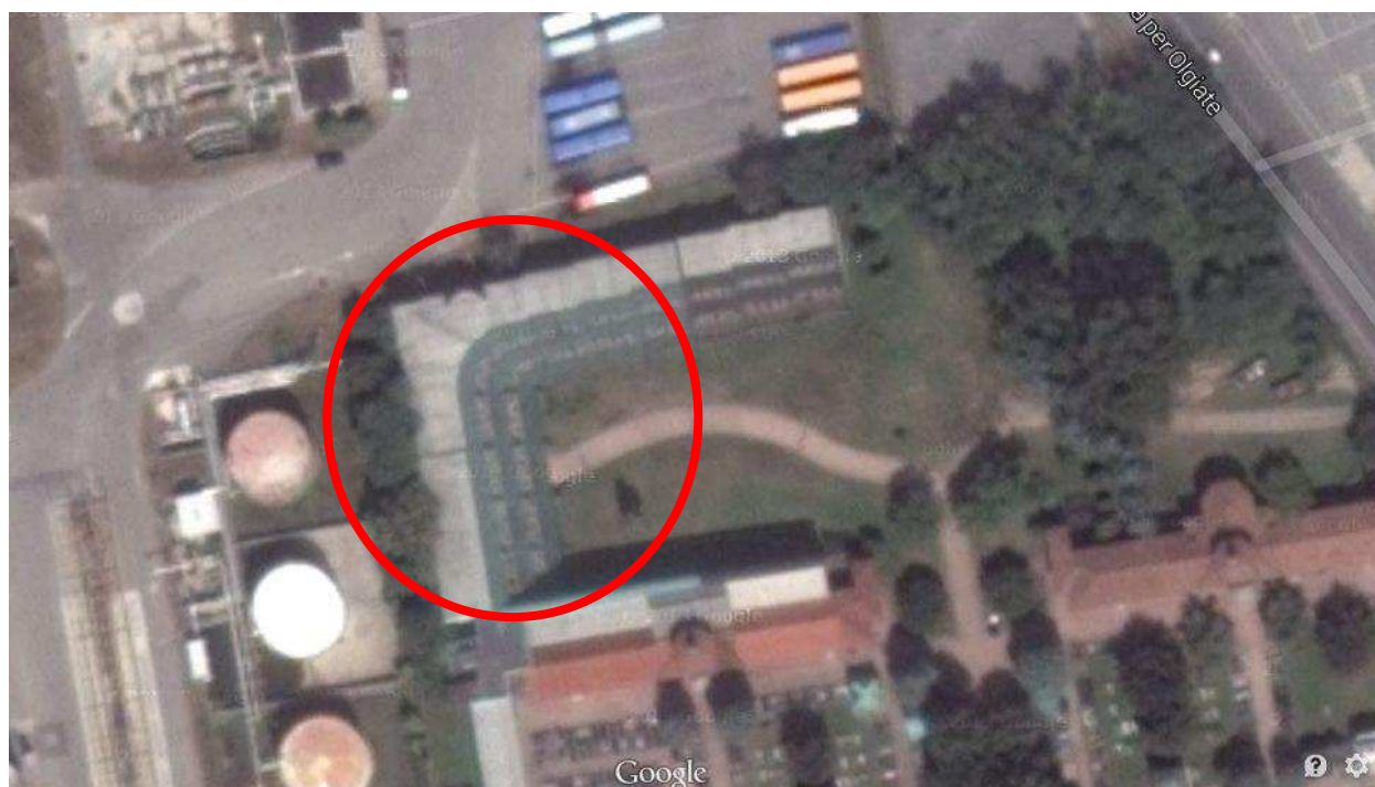
Fig. 2 – Immagine aerea colombari oggetto d'intervento.