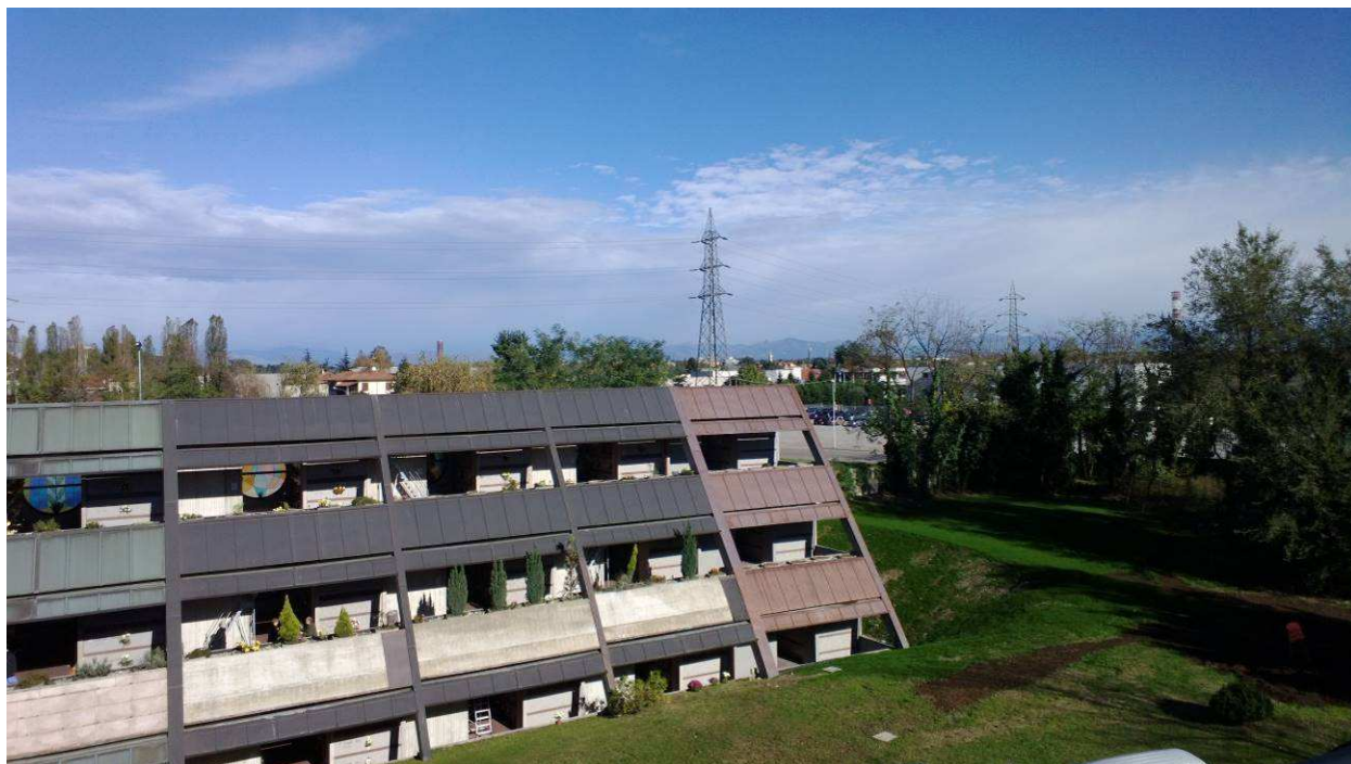
Fig.9 – Prospetto colombari con lastre di rivestimento delle fioriere mancanti.