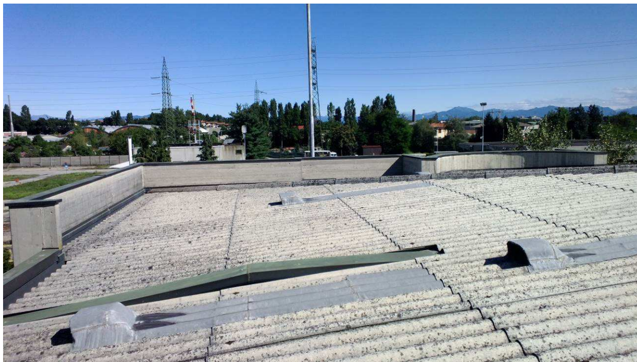
Fig.4 – Copertura in cemento-amianto oggetto di bonifica