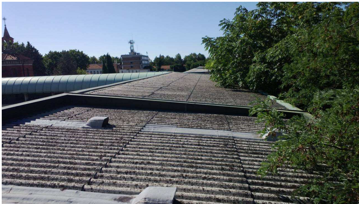
Fig.3 – Copertura in cemento-amianto oggetto di bonifica