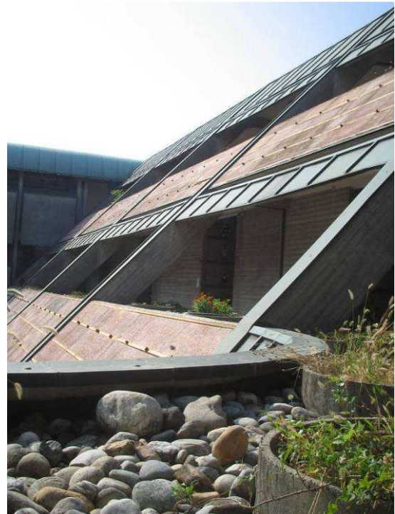
Fig.14 – Vista su fioriera da chiudere con lastra di pietra.