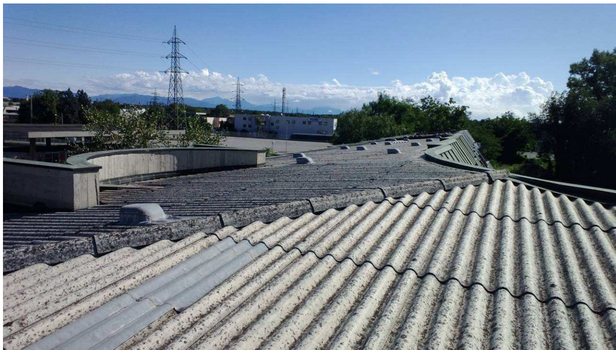
Fig.5 – Copertura in cemento-amianto oggetto di bonifica