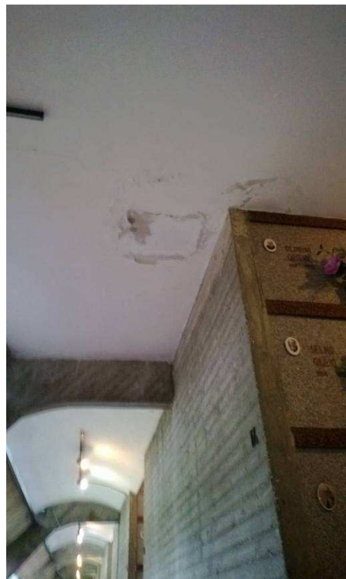
Fig.16 – Particolare infiltrazioni.