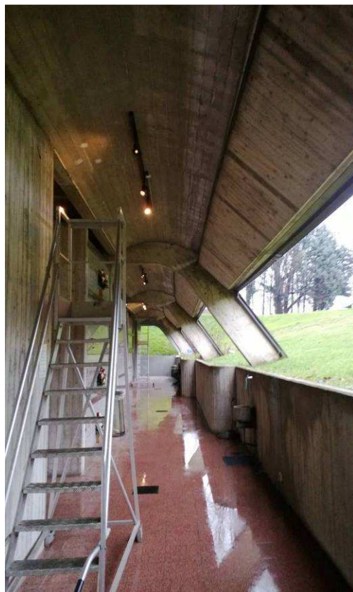
Fig.15 – Particolare infiltrazioni.