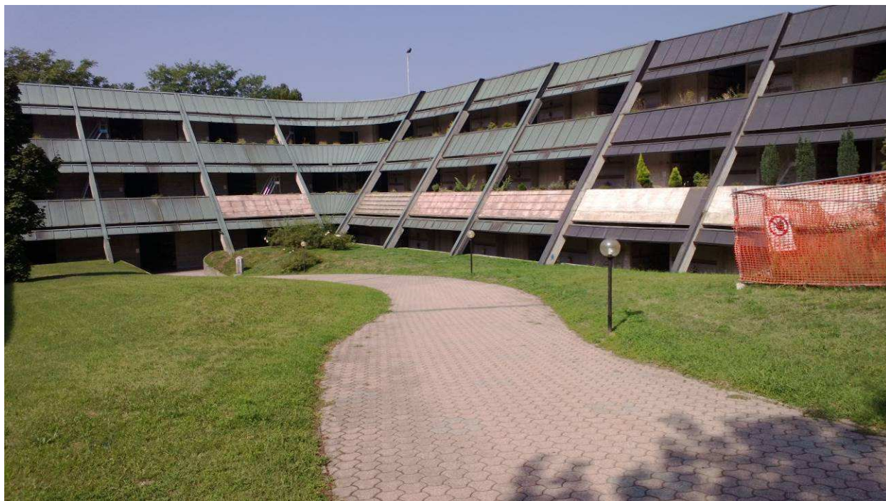
Fig.8 – Prospetto colombari con lastre di rivestimento delle fioriere mancanti.