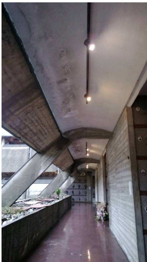
Fig.17 – Particolare infiltrazioni.