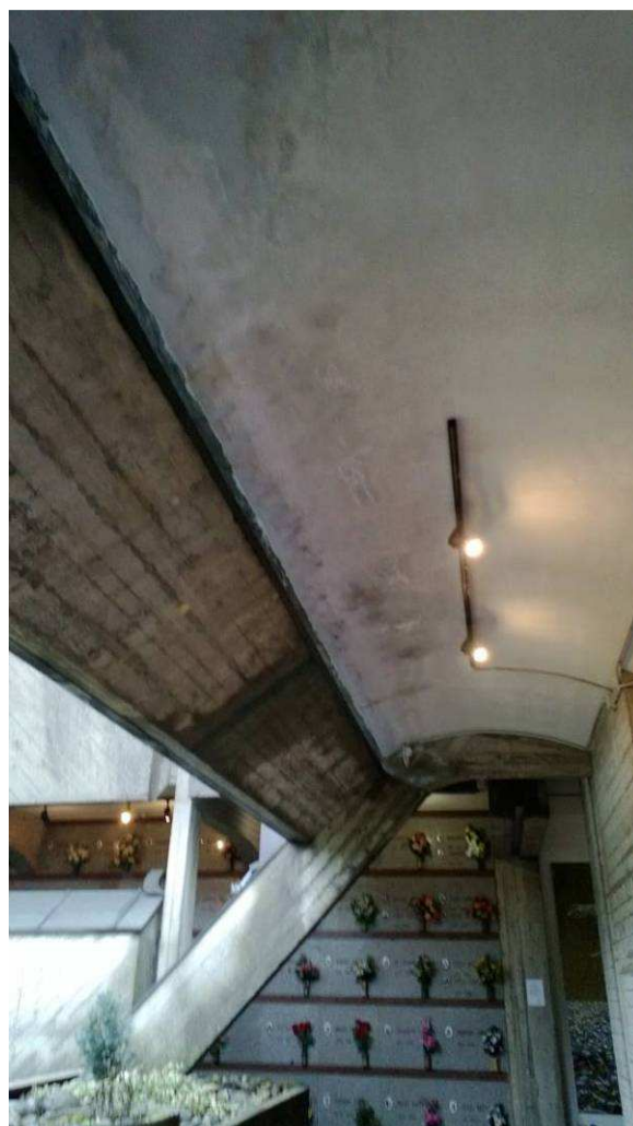
Fig.18 – Particolare infiltrazioni.