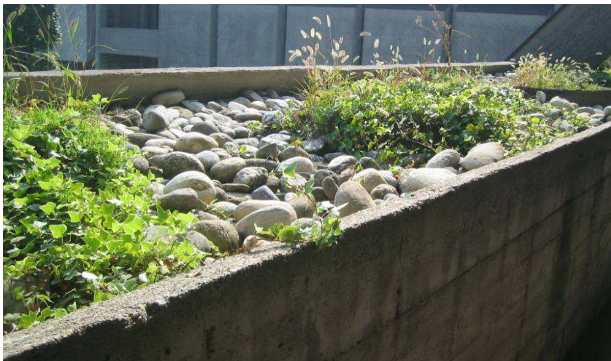
Fig.12 – Vista su fioriera da chiudere con lastra di pietra.