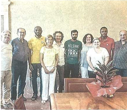
LA CERIMONIA L'incontro in municipio in occasione della Giornata del rifugiato