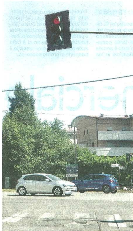
Novità all'incrocio tra la Saronnese e via Locatelli (Biliz)

pubblicato il 23/07/2018 a pag. 19; autore: Stefano Di Maria