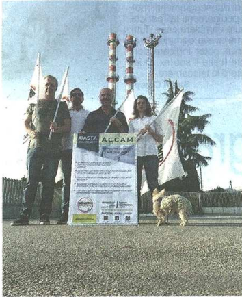
Forcing del Movimento 5 Stelle sull'Inceneritore

I Cinque Stelle parlano di «inerzia dei soci e di spudoratezza di Accam». «Ormai - scrivono in una nota, firmata dai consiglieri co-