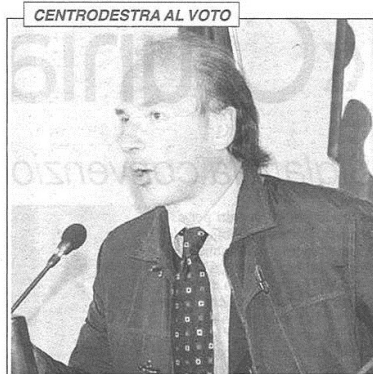
CENTRODESTRA AL VOTO

Ipotesi candidatura per il commercialista