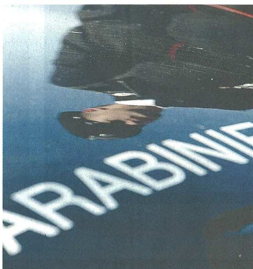
Intensa attività di controllo dei militari di Busto

È stato denunciato anche un cittadino albanese 40enne, per violazione della legge sugli stranieri: controllato in una zona residenziale della città, è risultato