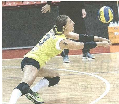
Per Valentina Rania e le sue compagne della Sab Grima Irge un'altra giornata negativa a Cuneo sul campo della capolista capace di imporsi in tre set

pubblicato il 14/12/2015 a pag. 31; autore: Filippo Cagnardi