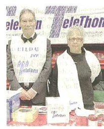
Alcuni momenti della manifestazione Telethon che si è tenuta domenica scorsa al Palaborsani di Castellanza