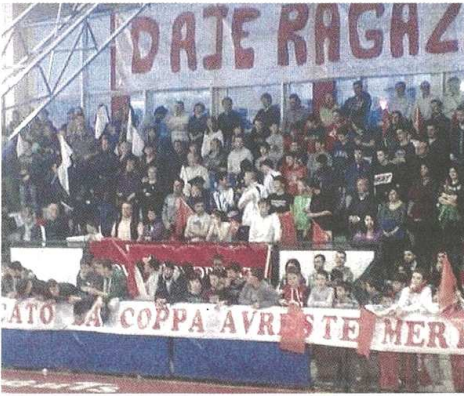
Il pubblico del PalaKnights continuerà a fare il tifo a Castellanza