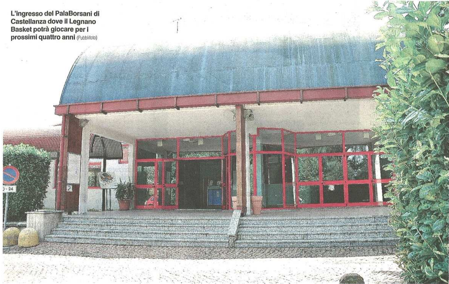
L'ingresso del PalaBorsani di Castellanza dove il Legnano Basket potrà giocare per i prossimi quattro anni (pubblicità)

pubblicato il 07/08/2014 a pag. 34; autore: Luca Nazari