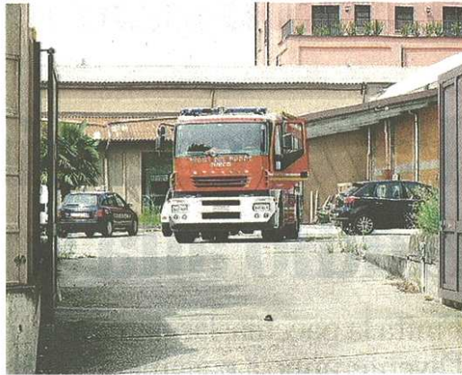
Il capannone dove è avvenuto l'incidente sul lavoro