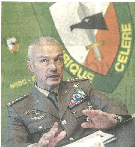
Il generale Giorgio Battisti ha comandato la Mara per più di due anni

Mentre sui tavoli politici si discute e si decide sull'identità di un'area come quella della provincia di Varese sempre in cerca di un ruolo chiaro e strategico nel contesto della Lombardia (vedi riforma della sanità) e di tutto il Nord Italia, ecco la testimonianza del generale di corpo d'armata Giorgio Battisti , per ventinove mesi al comando della caserma Ugo Mara di Solbiate Olona, ora a Roma per altri incarichi militari. Generale, dal 24 novembre 2014 lei non è più al comando di Nato Rapid Deployable Corps (Nrdc) di Solbiate Olona, ma lei è rimasto l'affetto per questo territorio?