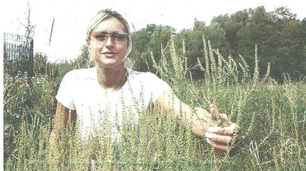
Diversi sindaci della zona hanno già dovuto firmare ordinanze di sfalcio

pubblicato il 08/08/2015 a pag. 30; autore: Veronica Deriu