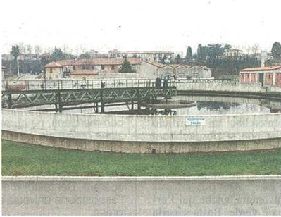
Il depuratore di Olgiate Olona