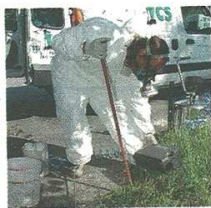
ADDETTI Derattizzazione a Castellanza