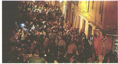
Un'immagine della notte bianca di Castellanza del 2015

Alle 21.15 si svolgerà lo spettacolo "The sound of musical" e a seguire salirà in passerella la prima squadra della Castellanzese, quest'anno grande protagonista con la promozione