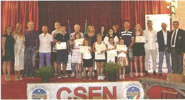
La consegna delle borse di studio ha coinvolto ragazzi dalle elementari alle superiori