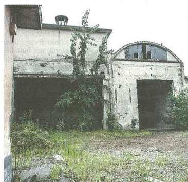
Qui sopra, una parte dell'area prima della demolizione. Sotto e nel testo i nuovi rendering