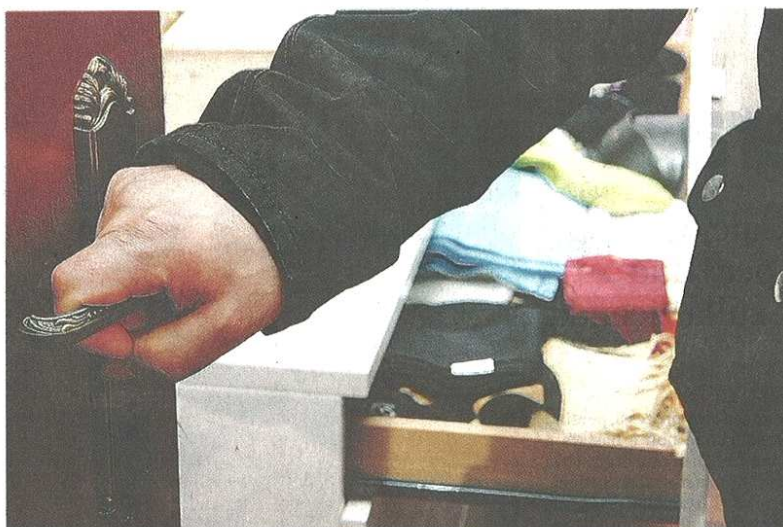
Dopo l'escalation di furti in appartamento in Valle Olona, Castellanza ufficializza i controlli di vicinato