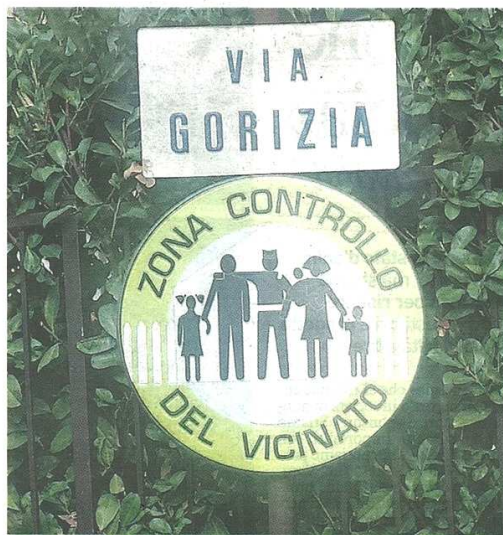
SEGNALETICA Uno dei cartelli realizzati per avvisare i malintenzionati

« GRAZIE alla collaborazione di queste persone - si legge nel comunicato riguardante l'iniziativa - nel quartiere si è instaurato un clima di sicurezza immediatamente percepito soprattutto dalle fasce più deboli, quelle che rimangono