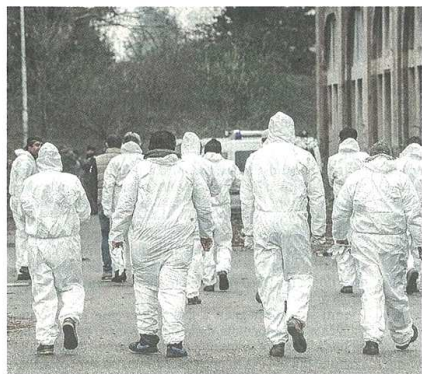
Sopra le forze dell'ordine accompagnano una donna fuori dall'area Ex Enel. Qui sopra la squadra impegnata nella bonifica