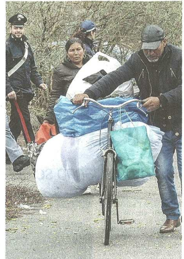
Alcuni momenti dello sgombero di ieri mattina all'alba. Gli abusivi si allontanano senza proteste raccogliendo in sacchi tutte le loro cose