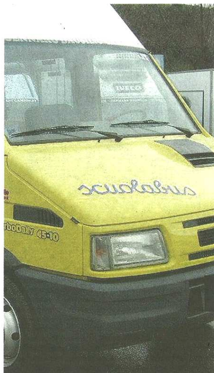
Gli alunni potranno usare altre linee, non lo scuolabus